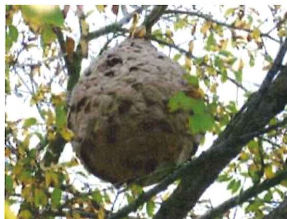
Nids secondaires à partir de l'été

Nid d'été de très grosse taille. Attention, il peut contenir plusieurs milliers de frelons. Son élimination par vos propres moyens peut être dangereuse.